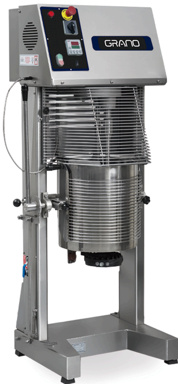
Misturador de Cozimento MCG30 | MCG70