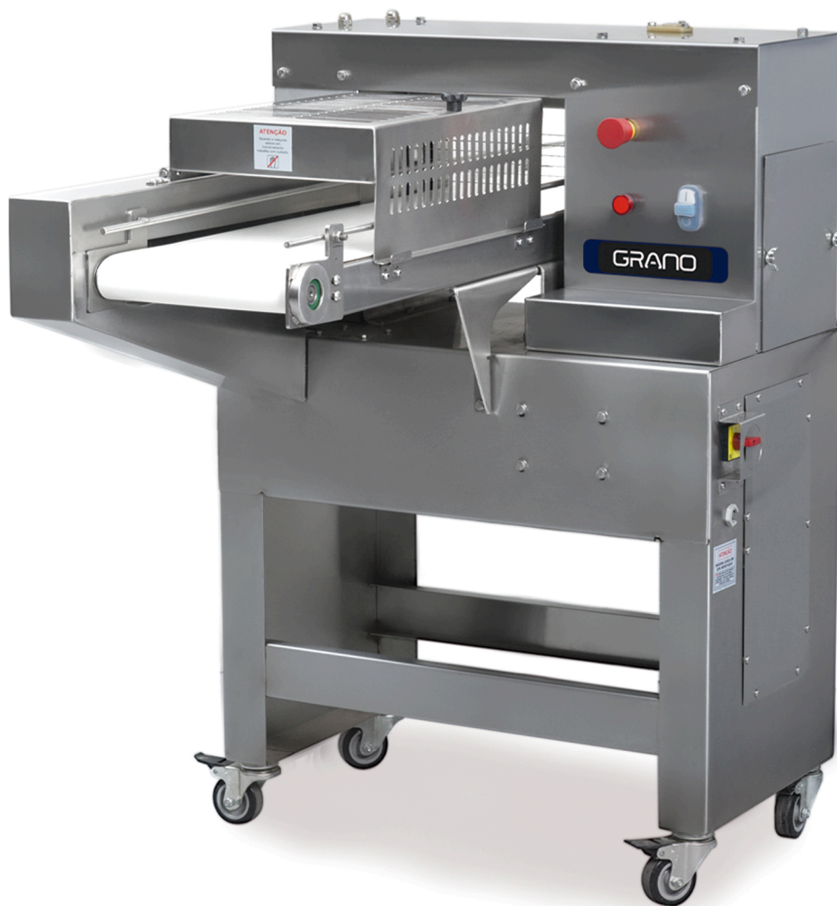
Fatiadeira de Bolos FBH240S